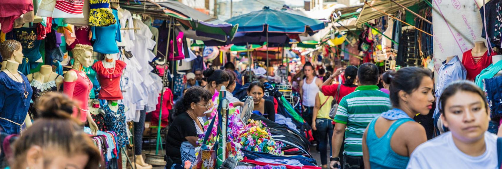
Mercado local en San Salvador, El Salvador